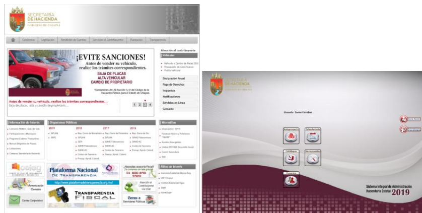
Figura 4. Sistema Integral de Administración Hacendaria Estatal (SIAHE).

El acceso al SIAHE se realiza desde el portal de internet en la página de la Secretaría de Hacienda, mismo que requiere para su uso de un usuario y contraseña.