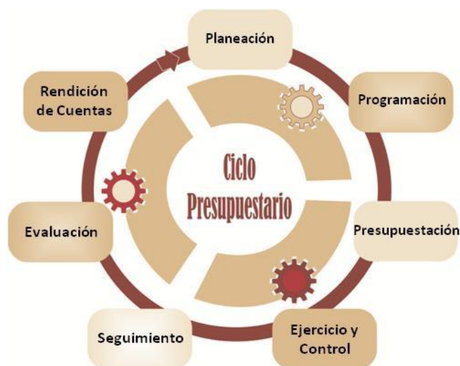
Figura 03.- Ciclo Presupuestario y su vínculo con el PbR.