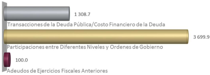
GASTO NO PROGRAMABLE ENERO - JUNIO 2019 ( Millones de Pesos )