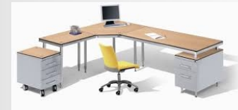
Equipo y mobiliario de Oficina