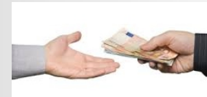
Pagos de Sueldos